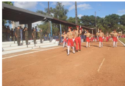
Desfile do Batalhão Escolar em continência ao Gen Ex Theophilo