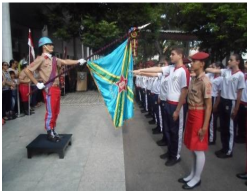
Juramento dos Novos Alunos perante o Estandarte do CMF

Para os novos alunos, o ano escolar começa mais cedo. Do dia 29 de fevereiro ao dia 2 de março, cerca de 142 novatos passaram pela Semana Zero. Durante a semana de adaptação, os novos alunos tiveram palestras sobre as instituições militares, o comportamento adequado, os uniformes e diversos outros temas que fazem parte do dia a dia de um estudante do Colégio Militar. Ao longo da semana de adaptação, alguns alunos veteranos do CMF auxiliaram os monitores na missão de ensinar aos novos alunos os movimentos de ordem unida, os toques de corneta e as normas do Colégio.