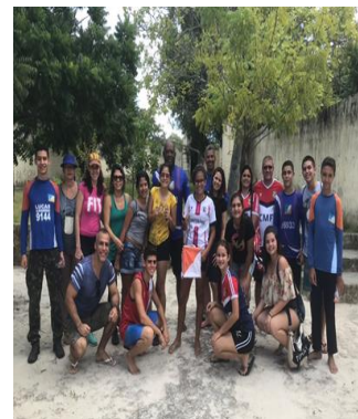
Atletas e militares do CMF

O CMF, afiliado ao Clube de Orientação Coqueiro, obteve as seguintes colocações na competição: na categoria “D” Juvenil Bravo, primeiro, segundo e terceiro lugares; na categoria “H” Juvenil Bravo, primeiro e segundo lugares; na categoria “H” Juvenil Alfa, primeiro e segundo lugares; e por fim, primeiro lugar na categoria “D” Infantil Bravo.